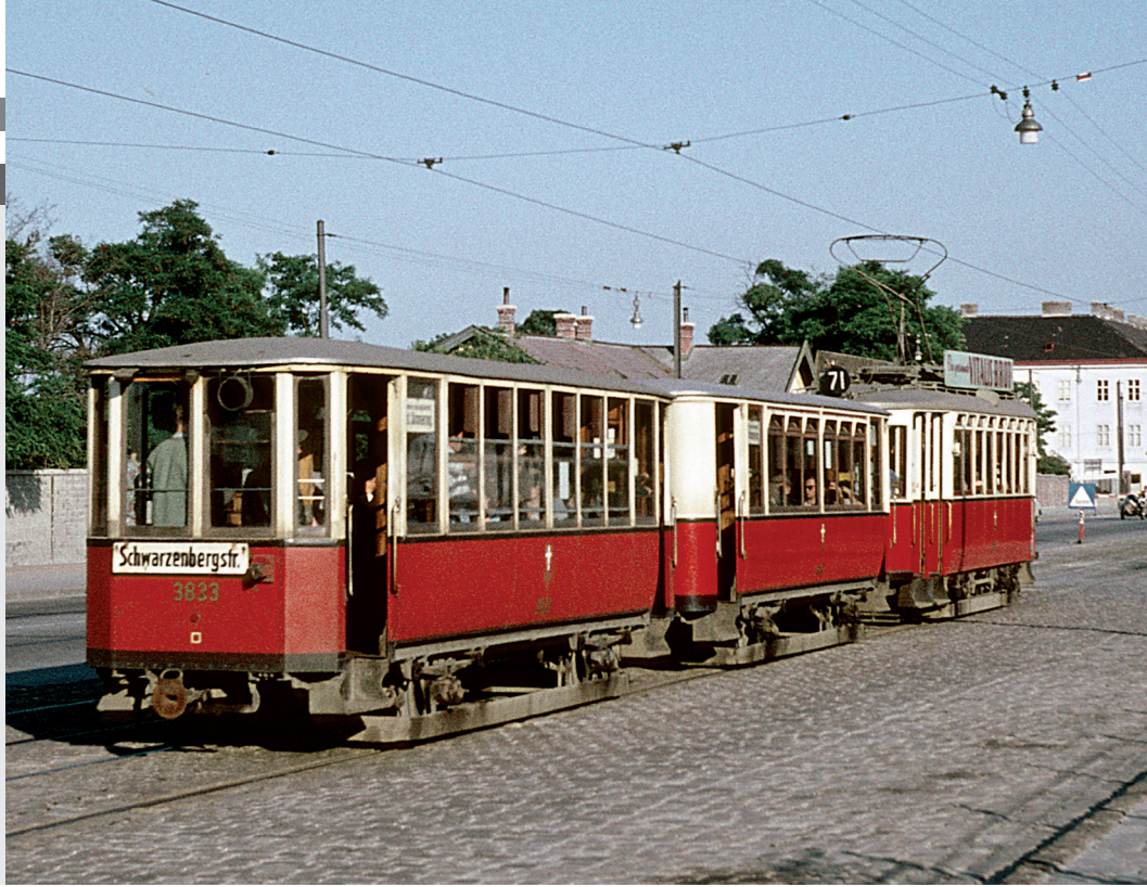
Foto: u2 3833+u2+K in St. Marx auf der Linie 71. Titelbild: K 2517 + u2 3819 + u2 1969 auf Linie 71 am Schwarzenbergplatz.

Im Herbst 1909 lieferte die Waggonfabrik Rohrbacher fünfzehn Sommerbeiwagen der Type u1. Im darauffolgenden Jahr kamen von der Simmeringer Waggonfabrik fünfzehn Wagen der Type u2. Ende 1911 erfolgte die Lieferung von weiteren 40 u2-Beiwagen, wobei fünfzehn Wagen von der Grazer Waggonfabrik hergestellt wurden. Bericht auf den Seiten 24 bis 35.